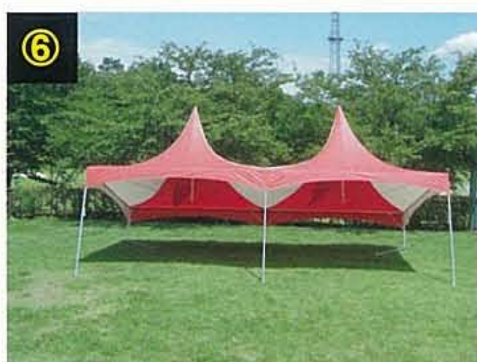
⑥ 片足ずつ立てます。