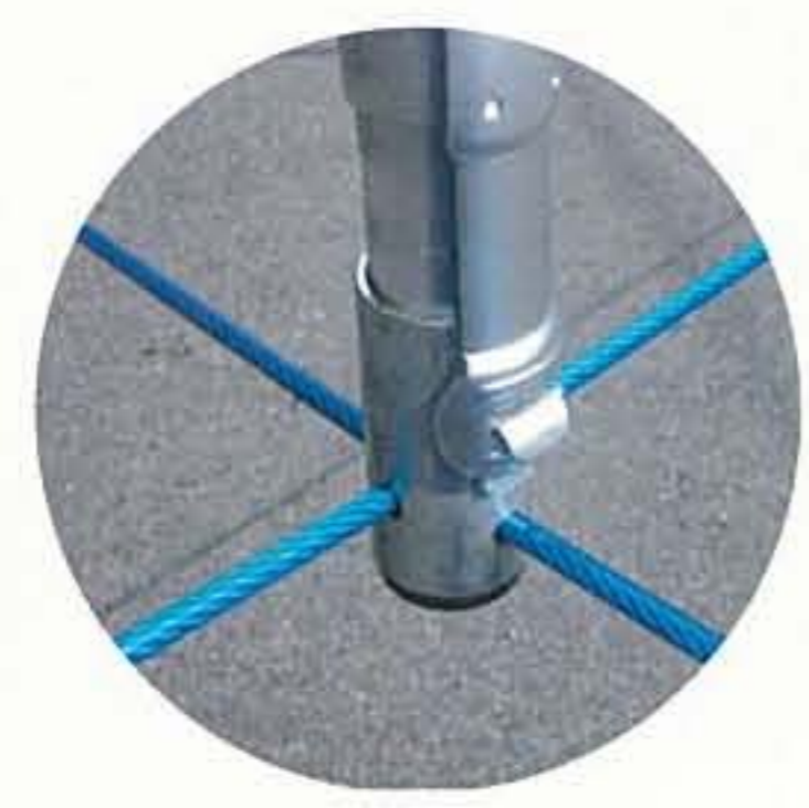
※セーフティーストッパーで、テンションパイプとワイヤーをより強力に固定します。