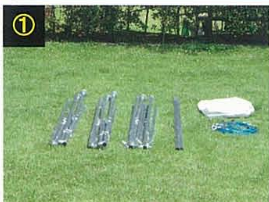
① 全パーツはワンタッチユニット式です。