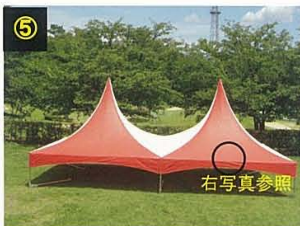
⑤ テンションパイプを右写真のようにセットします。