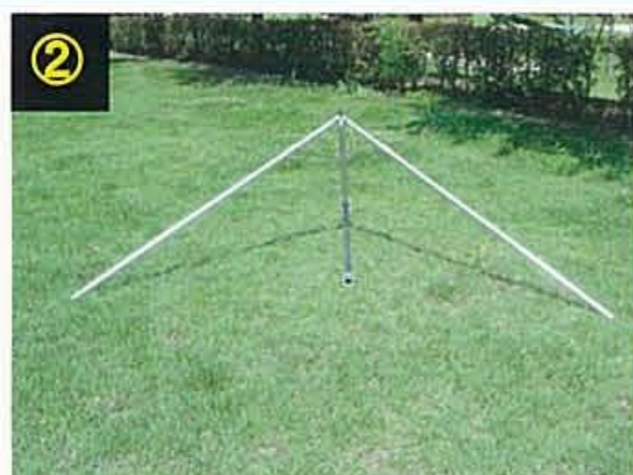
② ユニット化(束)の桁パイプのパーツを広げて立てます。