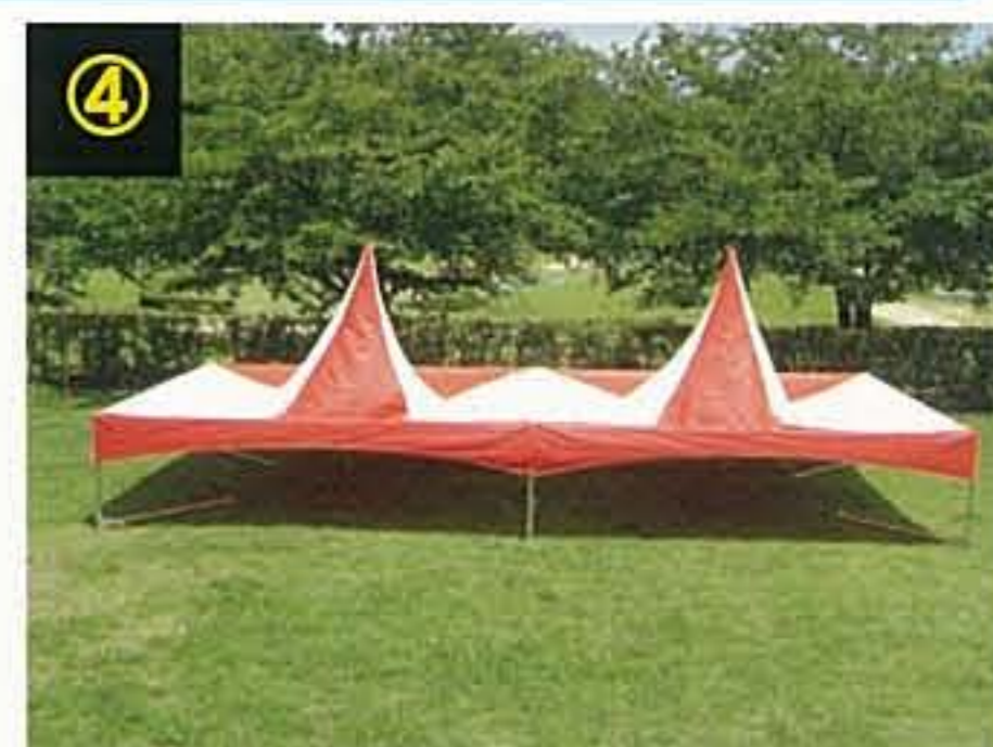
④ 天幕をかぶせ、テンションパイプを天幕の中から突き上げます。