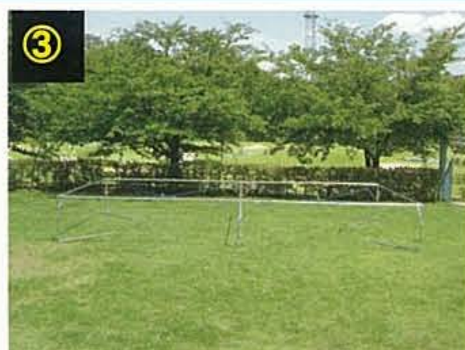
③ 広げたパイプをジョイントし、ワイヤーを取り付けます。